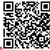
Facebook Saint-Cyprien animations