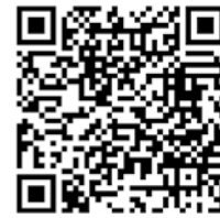
Billetterie en ligne

I Informations au 04 68 21 01 33 B Billetterie : • en ligne : tourisme-saint-cyprien.com • accueil Office de tourisme