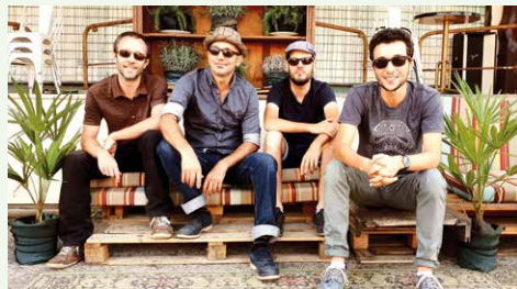
© Mister Leu and the Nyabinghers

De 21h à 22h > Mister Leu and the Nyabinghers. Mister Leu s'amuse à reprendre des standards de blues, jazz, soul comme le faisaient les Jamaïcains dans les années 30,40, 50... Il vous invite à découvrir l'île de la Jamaïque avec sa guitare, son harmonica et sa stompbox. Tout public - Gratuit sur réservation au 04 68 21 06 96 Les Collections de Saint-Cyprien, village